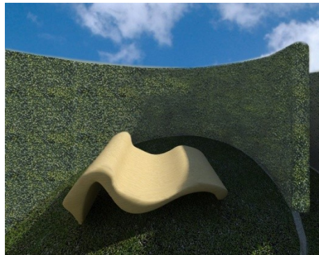
Figure 4-5 : Vista della seduta centrale temporaneamente occupata dalla Venere di Urbino (1537) di Tiziano in versione ecologica.

La seduta centrale è costruita con una macchina di Prototipazione Rapida che utilizza materiali naturali come argilla o prodotti di risulta dal processo di produzione dal Depuratore stesso.