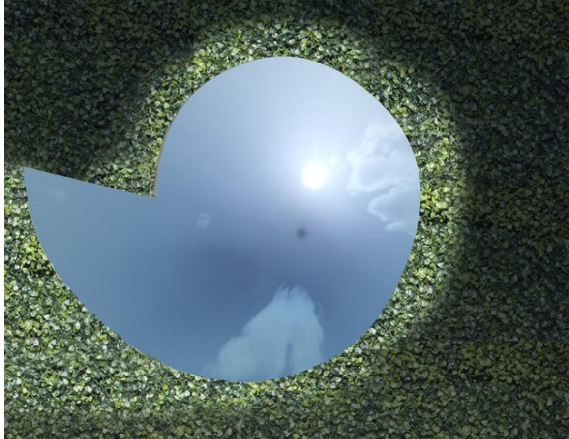
Figura 5: Sguardo verso il cielo dalla seduta posta al centro della spirale..

Sdraiati sulla comoda poltrona di morbido materiale si può gustare una pausa di relax e di distensione.