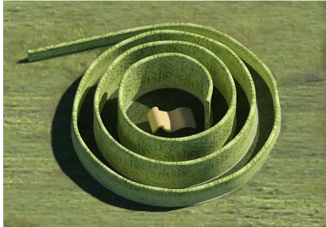
Figura 3: Installazione completa con al centro una seduta creata con tecniche di Prototipazione Rapida.

La spirale rappresenta quindi una conquistata barriera visiva ed acustica che favorisce il raccoglimento e la riflessione.