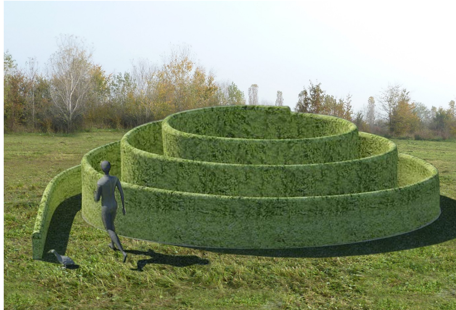
Figura 1: Spirale formata da una siepe che s'innalza nel percorso verso l'interno.

Attraverso un percorso a spirale composto da una siepe ad altezza crescente, si raggiunge il centro dove una seduta rilassante fornisce una pausa di riposo, lontano da stimoli e stress esterni.