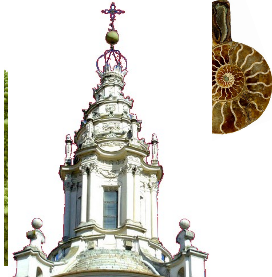
Figura 2: La spirale è una forma dinamica nella natura e nell'architettura.

Questo percorso permette un progressivo distacco dagli stimoli esterni favorito anche dalle strette pareti che lungo il tragitto aumentano in altezza fino a raggiungere il centro in uno spazio circolare rappresentante la conclusione e la conquista della conoscenza oppure semplicemente di un posto di meditazione.